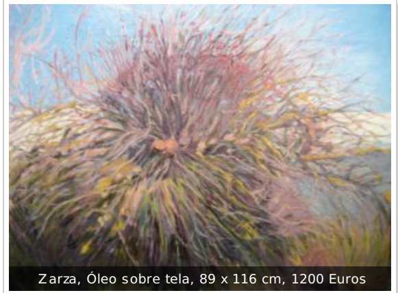
Zarza, Óleo sobre tela, 89 x 116 cm, 1200 Euros